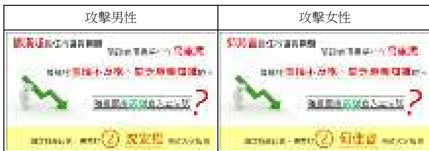
附錄十二：實驗三反駁廣告範例（反駁方候選人為男性、高度外表吸引力版本）